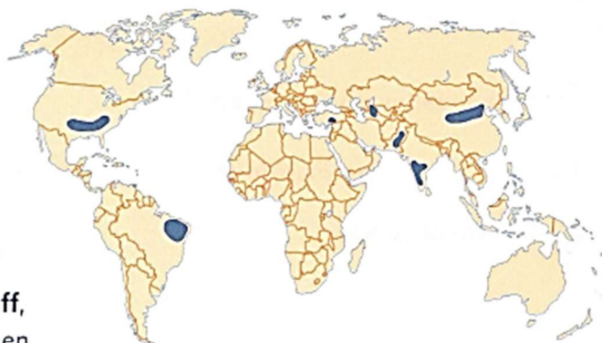
Länder, in denen Baumwolle wächst

Der Textknacker hilft dir, den Text zu lesen und zu verstehen.